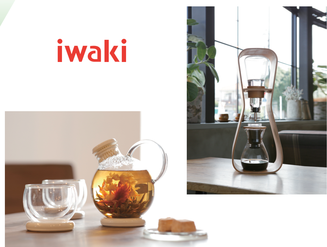
AGCテクノグラス製 ガラスコーヒーマグ&ティーセット SNOWTOP