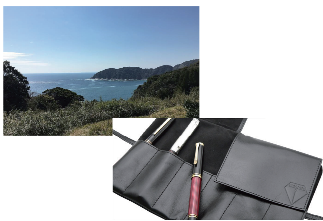
川島氏がまちづくりに携わる 鹿児島県肝付町特産品 佐藤氏おすすめ 「MAGGIORE」ペンケース