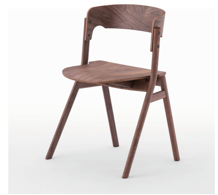
JIN KURAMOTO STUDIOデザイン MEETEE Sally チェア 2脚