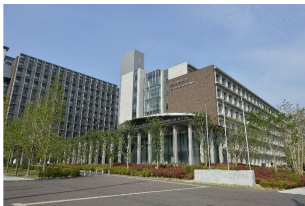
社会連携講座が設置される東京理科大学葛飾キャンパス

東京理科大学とAGCは、本連携講座を通じ教育及び研究の進展と充実を図り、将来の日本の学術と産業を支える人材の育成を活性化するとともに、学術・産業の発展に寄与することを目指します。