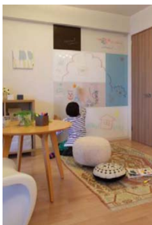
落書き壁としても使用できます