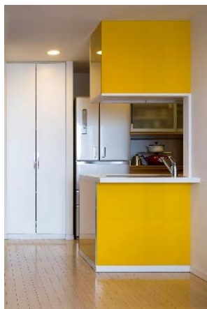
お部屋のアクセントとして