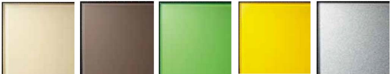
ライトベージュ ナチュラルブラウン ルミナスグリーン リッチイエロー* リッチアルミニウム*