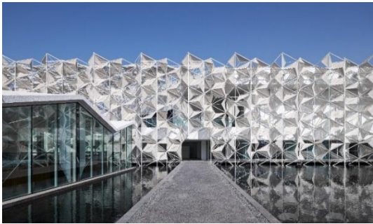
* 2020年ドバイ国際博覧会日本館 提供

▶ 外装用ガラスや手すり用壁ガラス等、ガラスの透過性や質感を生かし、つながりのある空間づくりに貢献しています。