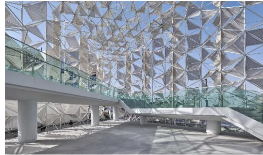
* 2020年ドバイ国際博覧会日本館 提供