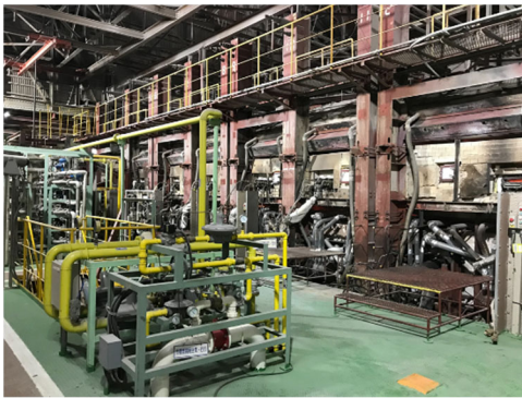
実証試験を行うガラス溶解炉

本プロジェクトでは、燃焼時にCO 2 を生成せず、既に肥料や工業原料として広く流通しており、プロパン同様の貯蔵性・輸送性を有するアンモニアに着目しました。AGC横浜テクニカルセンターの建築用ガラス製造設備にアンモニア-酸素燃焼バーナーを導入し、アンモニア燃焼技術の実証試験を行います。アンモニア燃焼におけるガラスや溶解炉を構成する材料への影響を評価するとともに、環境基準を満たすことのできるバーナーを開発し、ガラス溶解炉への本格導入を目指します。また将来はガラスのみならず、鉄鋼やアルミなど、他素材製造工程への展開も検討していきます。