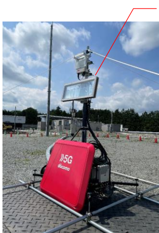
可搬型 5G 基地局