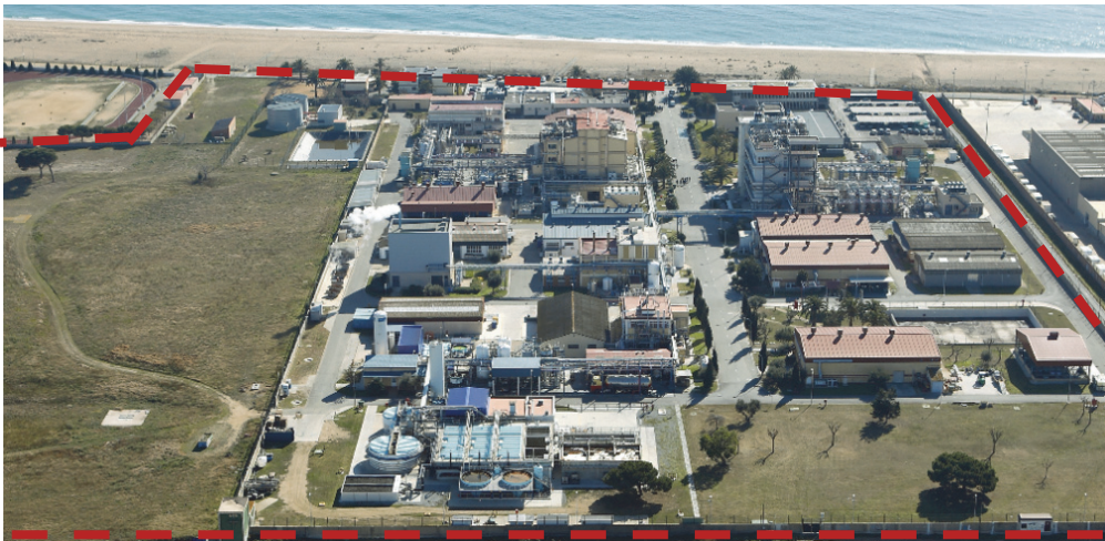
MPC 社 外観 破線部内は MPC 社敷地