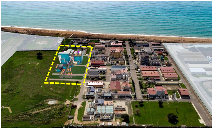
設備増強予定地（黄線部分）

AGC（AGC株式会社、本社：東京、社長：平井良典）は、当社合成医薬品 *1 CDMO *2 事業子会社であるAGC Pharma Chemicals Europe S.L.U.（以下APCE社、本社：スペイン）の設備増強を決定しました。同社敷地内に延床面積 7,500 m 2 の建屋を新設し、現在の生産能力を 30%増強します。稼働開始は 2024 年上期を予定しており、投資総額の見込みは約 120 億円となります。