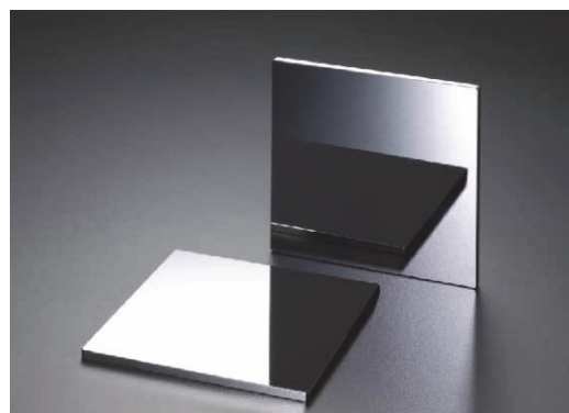
EUV マスクブランクス