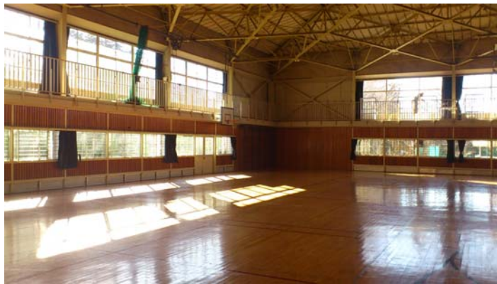
栃木県真岡市立真岡小学校の体育館（指定避難場所）

防災ガラスは、「合わせガラス」と呼ばれる構造になっており、地震や台風、突風でガラスが割れた際に、破片が飛び散るのを防ぐため、児童や避難者をガラスの破片によるケガ等から守ることができます。学校などの指定避難所において防災ガラスを採用することで、万一の自然災害時にも安全・安心を確保することが可能です。