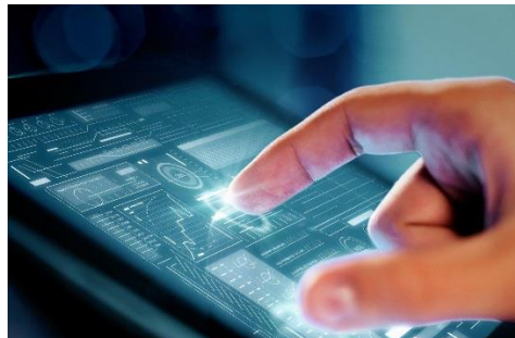
防汚コーティングの使用イメージ

今後AGC旭硝子は長年培ったフッ素製品の関連技術・ガラスへのコーティングノウハウなどを活かして製品ラインナップを拡充するとともに、コーティング剤処方などのテクニカルサービスを併せて提供し、ユーザーのニーズにきめ細かく応えていきます。