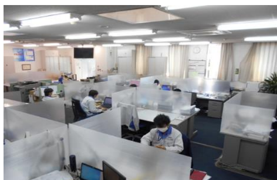
※上記写真は当社グループ事務所における、執務席パーテーションとしての設置例

今回、新型コロナウイルスの感染拡大下で需要が見込まれるオフィス空間の飛沫感染対策に有効なパーテーション用途としてツインカーボ®を企画・提案したところ、お客様からの関心が非常に高く、今後の需要増加に対応するため、生産体制を増強しました。オフィス空間の開放感やデザイン性を損なうことなく、新型コロナウイルスの飛沫感染対策をご検討いただけます。