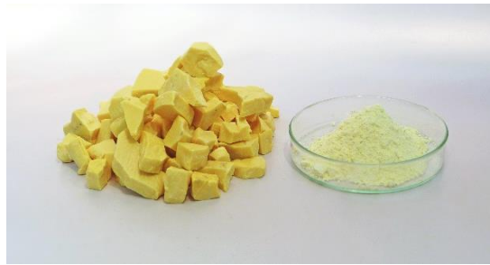
新たな生産技術で作製したアルジロダイト型硫化物固体電解質

AGC（AGC株式会社、本社：東京、社長：平井良典）は、車載用全固体電池に使われる硫化物固体電解質の量産に向けた、新たな生産技術の開発に成功しました。今後事業化に向け、生産プロセスや品質の改善を進めてまいります。