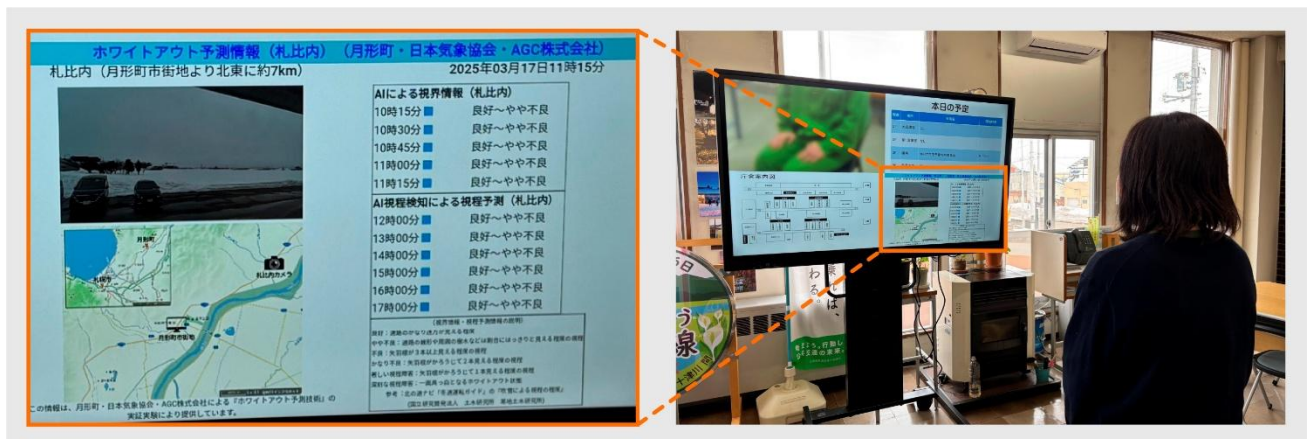
ホワイトアウト予測情報のデジタルサイネージ（月形町役場 1 階ロビー）

AGC（AGC株式会社、本社：東京、社長：平井良典）、日本気象協会（一般財団法人 日本気象協会、本社：東京、理事長：渡邊一洋）、北海道月形町（町長：上坂隆一）は、 2024年12月に発表 した月形町内におけるホワイトアウト *1 の発生予測およびリアルタイムの情報発信技術の実証実験（以下、本実験）を、2025年3月31日に終了しました。実施後のアンケートから、月形町を含む地域住民に移動計画の変更や安全運転への意識向上といった変化が確認され、今回の取り組みが冬季の交通事故リスクの低減に寄与したことが明らかになりました。